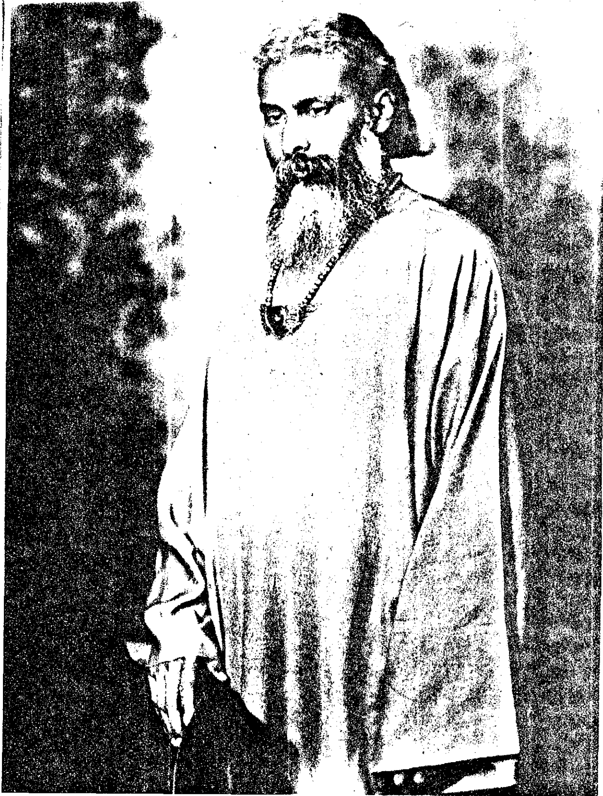
Pir - o - Murshid Hazrat Inayat Khan